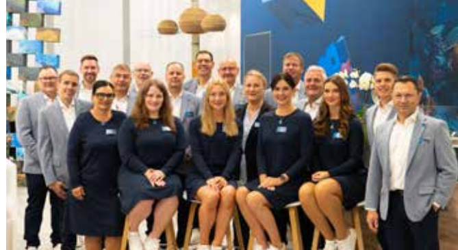
Motiviertes Team: Die strahlende Messe-Crew am KOLB Stand.