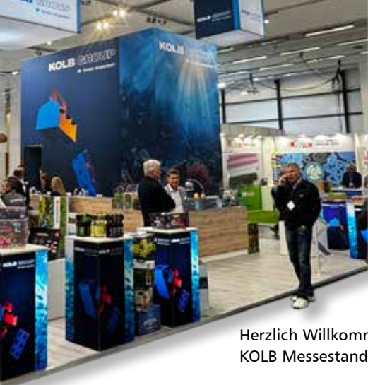
Herzlich Willkommen: Der KOLB Messestand in Halle 4A.